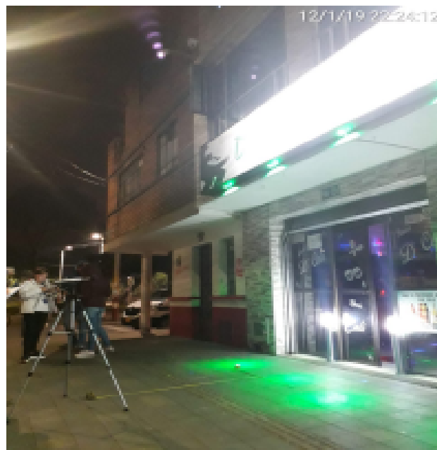
Fotografía No 6. Punto de monitoreo de los niveles de presión sonora sobre la Carrera 17