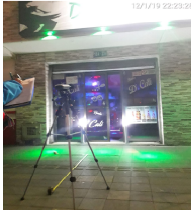
Fotografía No 5. Punto de monitoreo de los niveles de presión sonora sobre la Carrera 17